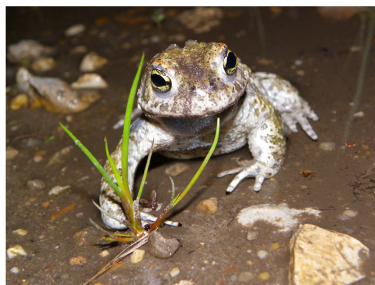
Crapaud calamite - espèce emblématique des zones sableuses