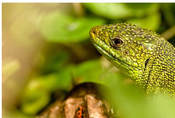
Lézard vert - espèce du site de Bazouges