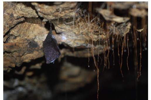
Petit Rhinolophe

Chaque hiver, 4 réseaux de cavités connus pour l'hivernage des chauves-souris sont suivis dans le périmètre du site Natura 2000 de la vallée du Loir. Elles se situent sur les communes de Luché-Pringé et Aubigné-Racan. En 5 ans, les effectifs ont doublé, atteignant une population hivernante de 1668 individus, soit 20% des effectifs sarthois. Cette augmentation conséquente est à imputer aux Rhinolophes (grands et petits) trouvant des conditions d'hivernage optimales sur un des sites de Luché-Pringé. Par ailleurs, ce site fait l'objet d'une demande de classement en APPB (arrêté préfectoral de protection de biotope) pour ainsi compléter l'outil contractuel Natura 2000 par une protection réglementaire plus forte pour ce site d'hivernage.