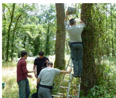
Sauvetage pique prune - Vaas 2011