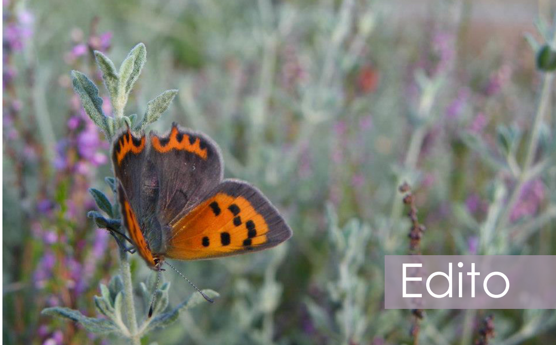
Cuivré commun - landes - aérodrome de la Flèche