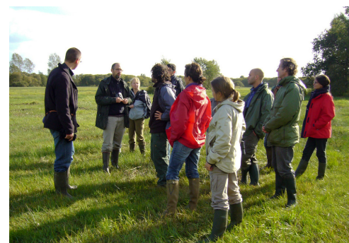
Formation Natura 2000